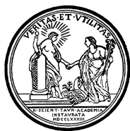
ACCADEMIA DELLE SCIENZE DI TORINO

L'Accademia delle Scienze di Torino, dove di particolare rilevanza sono la conservazione dell'importante patrimonio librario storico unito all'elevato carico d'incendio ed alle necessità derivanti dalla presenza di pubblico, in particolare nella monumentale Sala dei Mappamondi. (dal 2017, in corso)